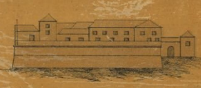
Plano de Porto Santo, a residência do governador militar da Ilha de Porto Santo.

Escala de 1:50,000 por 1 milha geog. em 1852. 2