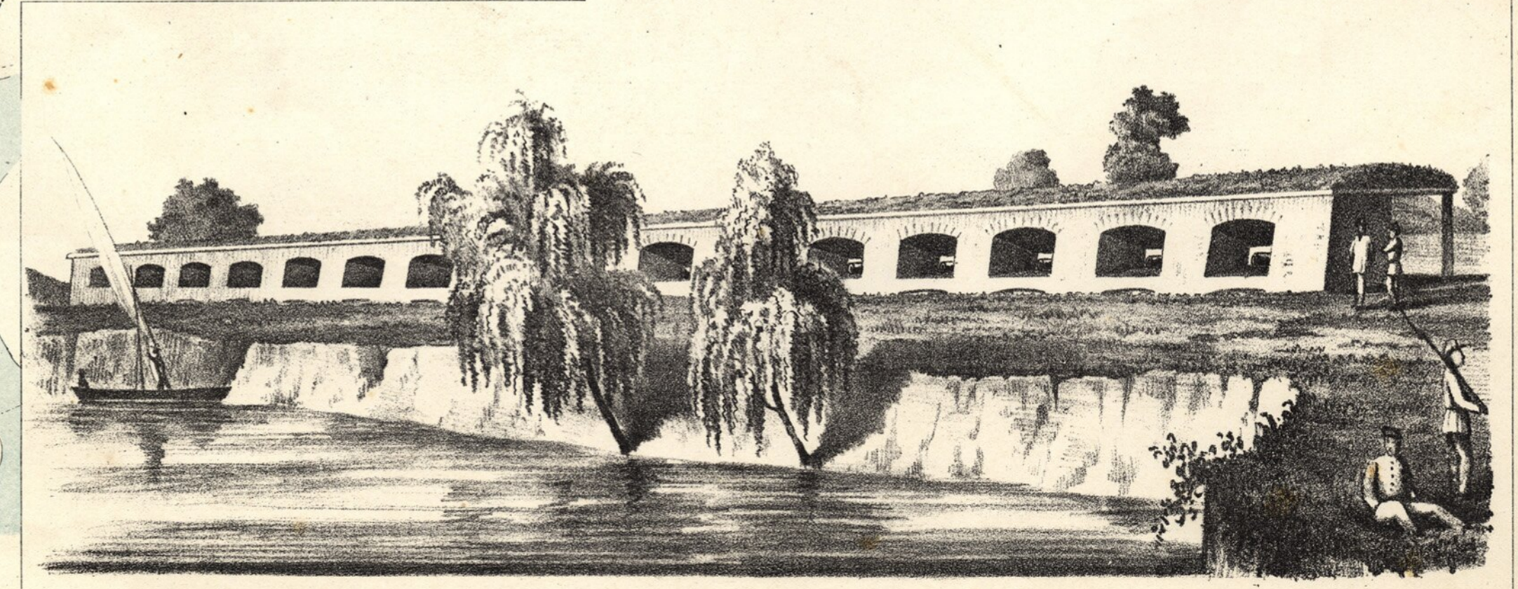
Bateria de Londres