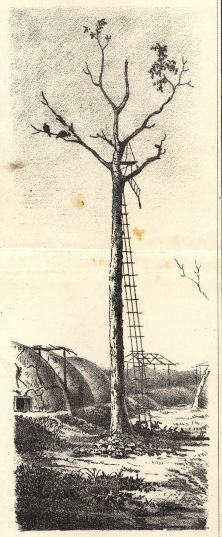
Mangrullo do Passo Tanymbú