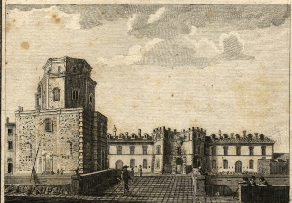
Porta S. Marco