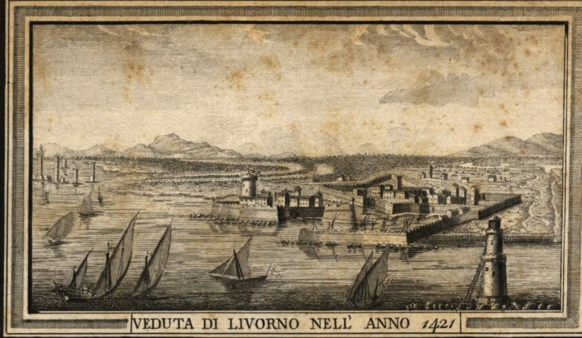
VEDUTA DI LIVORNO NELL'ANNO 1421