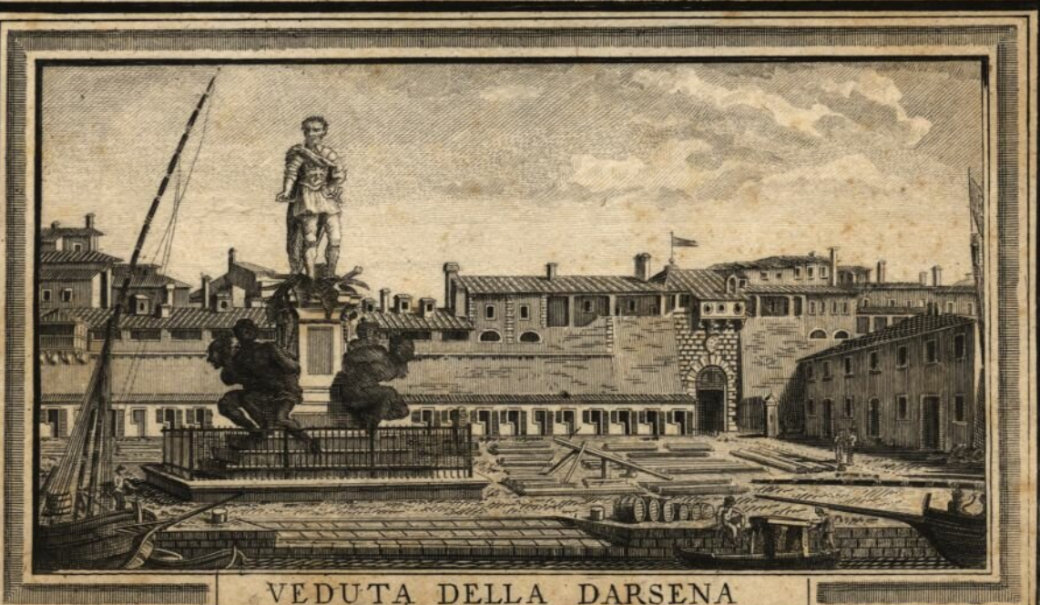
VEDUTA DELLA DARSENA

Dedicata agli Almi S. Consoli e Negozianti residenti nella suddetta Piazza Aut. Piemontese: detta Prolungata di Vienna disegnat. Antonio Piemontese