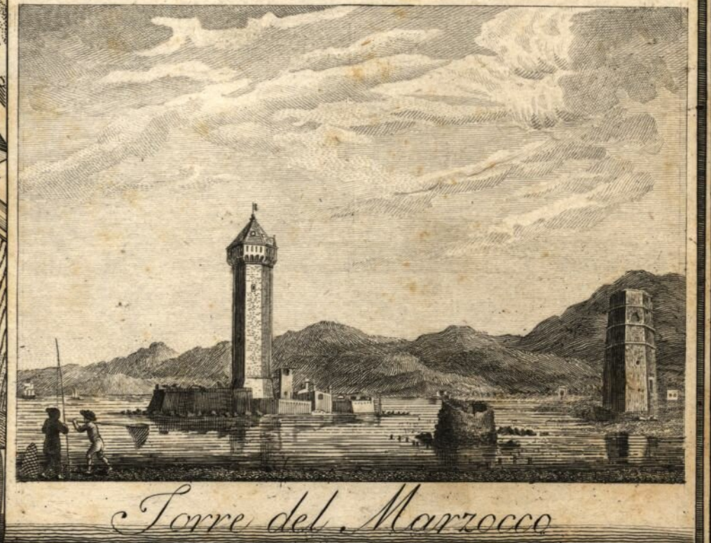
Torre del Marzocco