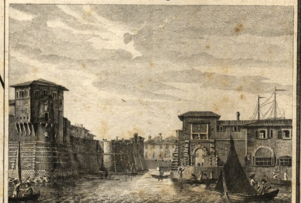
Bocca della Darsena