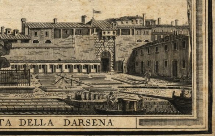
TA DELLA DARSENA

ccini contornò la Pianta, e Giuſ. Angeli incise