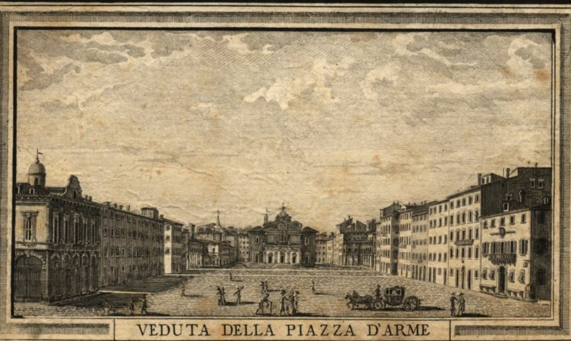
VEDUTA DELLA PIAZZA D'ARME

Scala di Braccia Fiorentine Scala di Piedi di Parigi