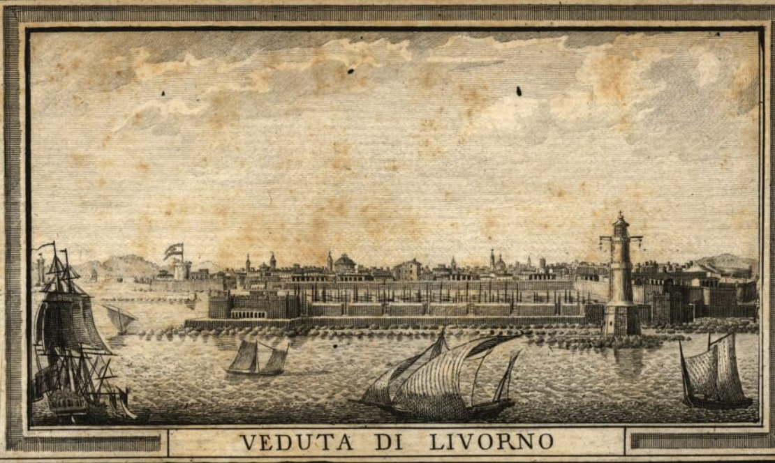
VEDUTA DI LIVORNO

Stampa della Città e Porto di Livorno fatta nel Principato d'Ungheria di Boemia Arciduca d'Austria Sotto il Regno di S. M. Ferdinando III Gran Duca di Toscana &c. &c. &c.