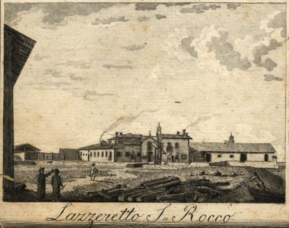
Lazzaretto S. Rocco