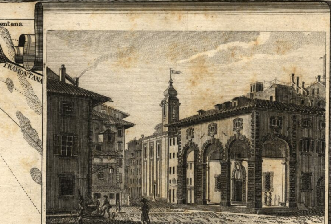
La P. Dogana