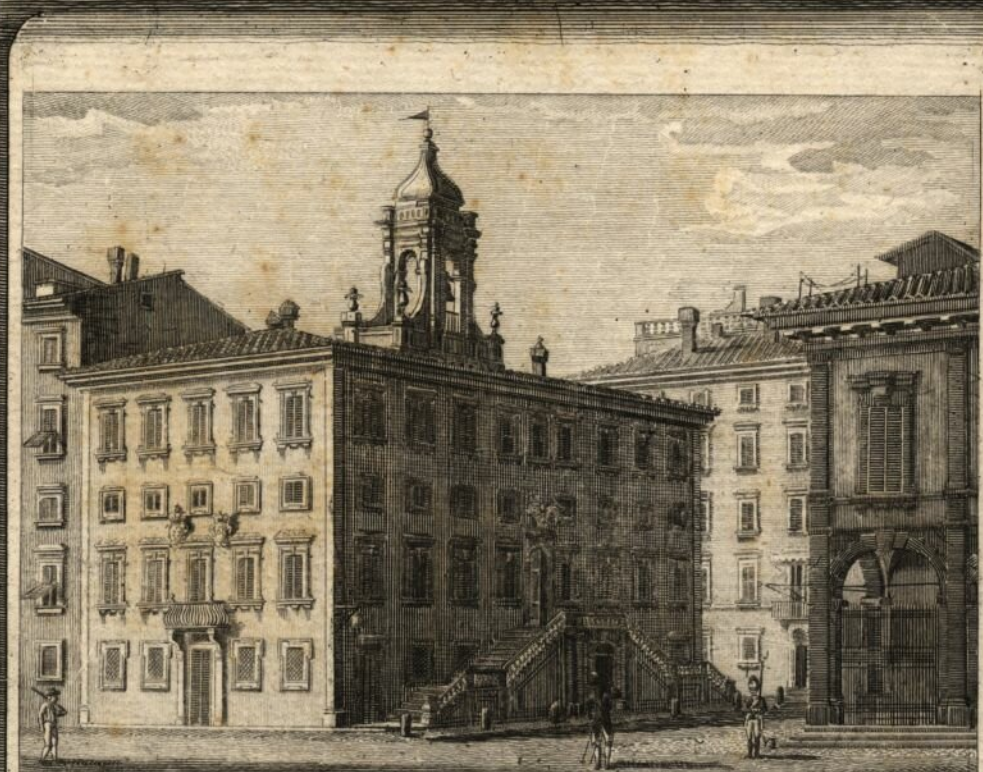
Palazzo della Comunità