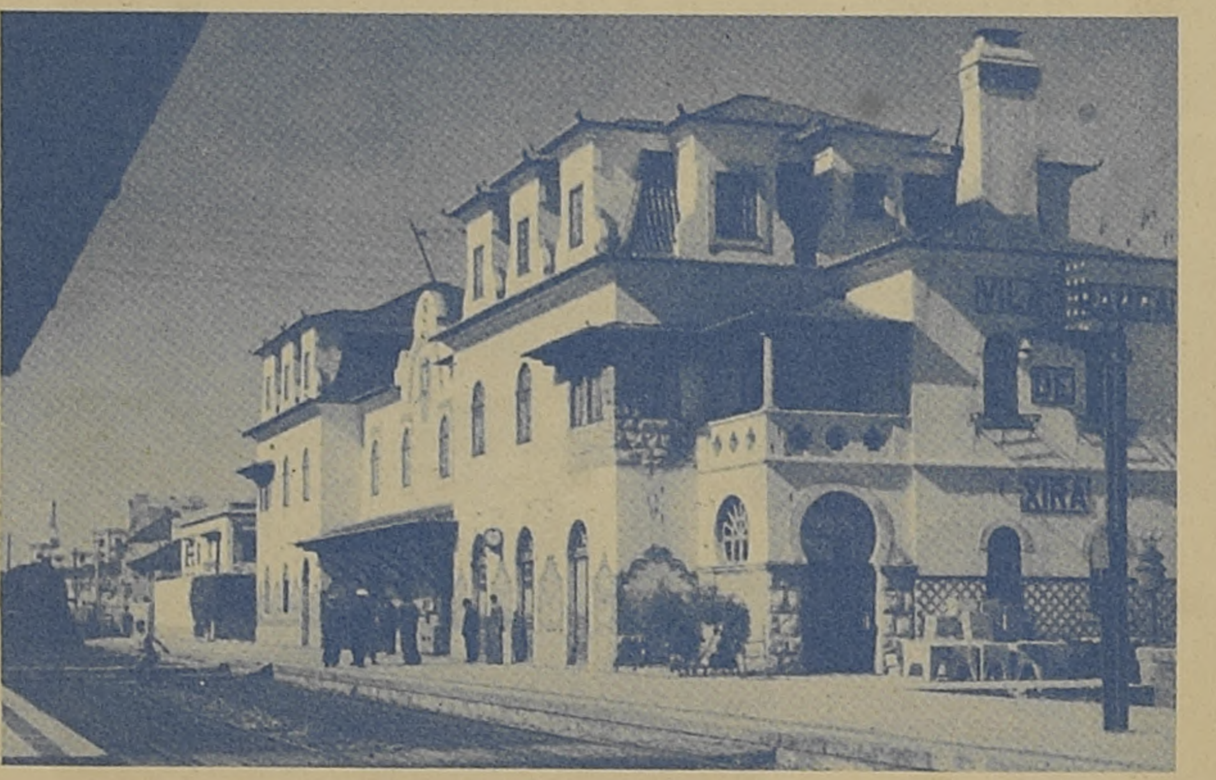
Estação de Caminho de Ferro

Edição da ROTEP, L.ª — Avenida da Boavista, 1424 — PORTO Com o patrocínio da Ex.ª Câmara Municipal de Vila Franca de Xira