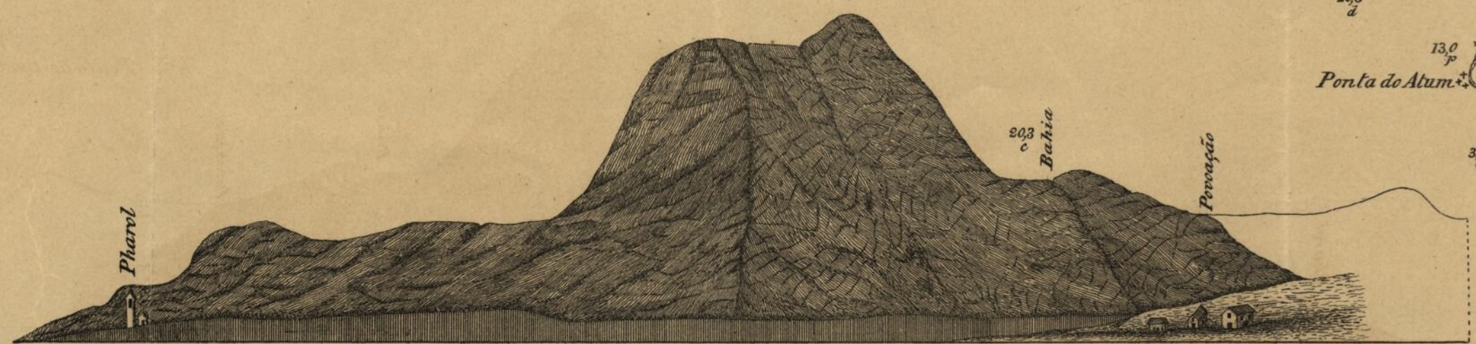
Aspecto do terreno marvando-se o Monte Graciosa ao NE á distancia de 6 milhas.

Estabelecimento do porto 71° 28' m' Amplitude da maré 1 m 5' Pharol, luz branca visivel a 9' Lat. N. 15° 18' 6" Variação d'agulha 19° N 189' Long. W. G. 23° 47' 06" As sondas estão expressas em metros