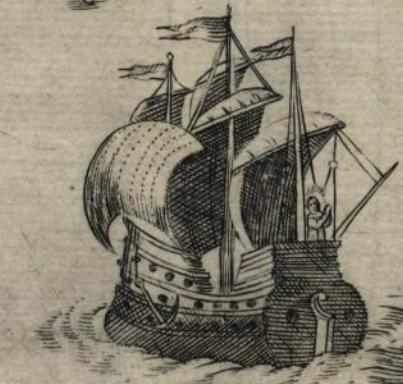
S. Franciscus Xaverius Iaponiam Applus appellit Cangoximam 15. Aug. ann. 1549.

Iapon diuiditur in 66. Prouincias siue Regna notata lit. P. per omnia dilata: ta est Fides Catholica: labore & industria Religiosorum Societatis IESV, multa cen- tena Christianorum millia numerantur. Habit Societas IESV diuersis temporib? Collegia sex, Residentias maiores, seu Collegia inchoata tria, Domos Proba- tionis duas, Residentias 64. Semina- ria duo. Plurimi pro Xpo mortem MERIDIES oppetierunt.