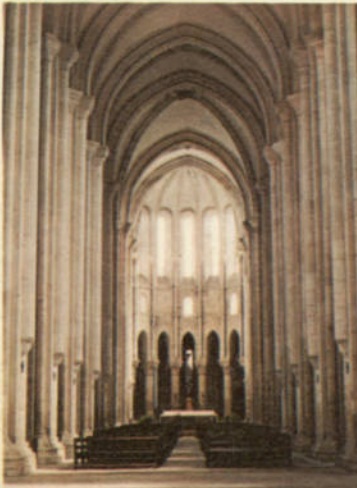
LISBOA — MONASTERIO DE LOS JERONIMOS