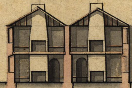
Secção d' E, F.