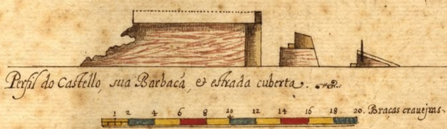
Perfil do Castello, sua Barbaca, e estrada cuberta.