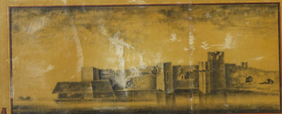
Prospecto de L.M. antes de se reedificar, tirado do ponto Z.

Petipé de 60 palmos Inspector o Cap. am M. el de Olivr. a e Figueiredo Importancia da Obra