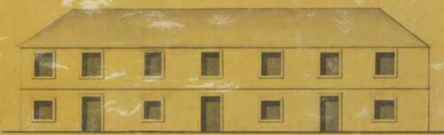
Prospecto de B. C.