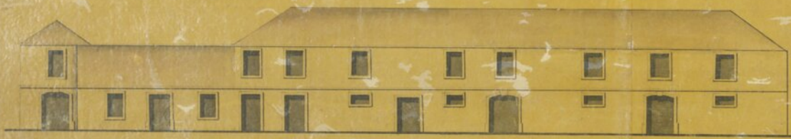
Prospecto de A. B.