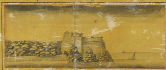
Prospecto tirado do ponto F.