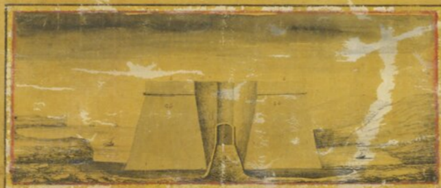
Prospecto tirado do ponto G.