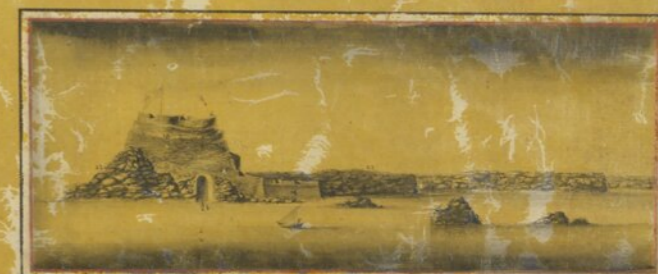
Prospecto tirado do ponto C