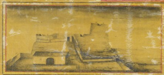
Prospecto tirado do ponto A