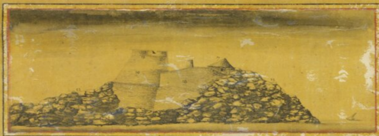
Prospecto tirado do ponto D.