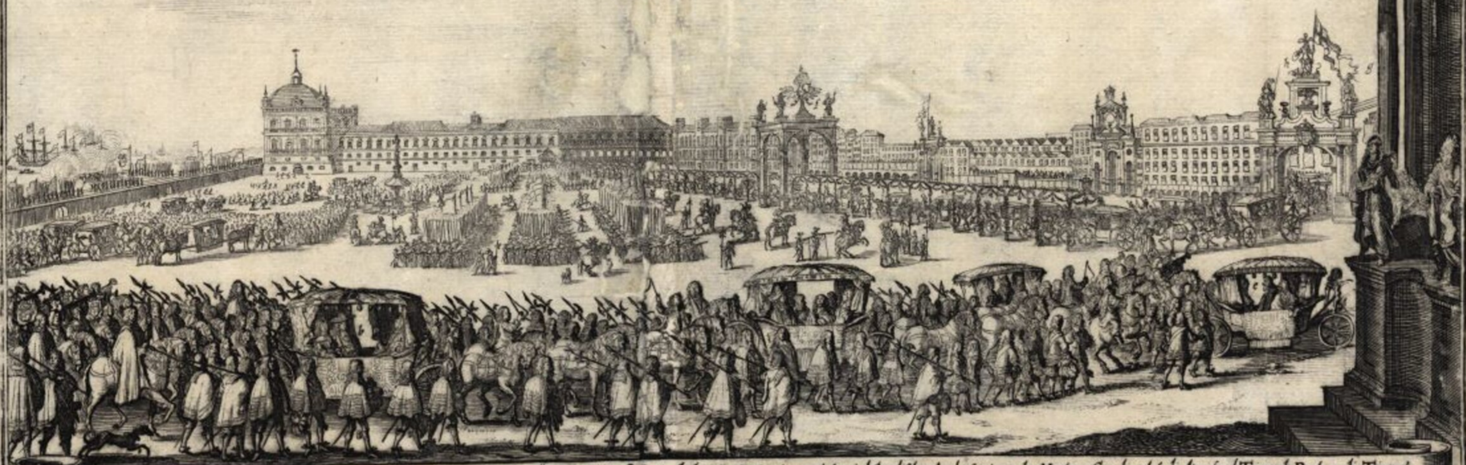
a. die Königin Catharina von Gros Britanien. b. Alphonsus König in Portugall. c. Don Pietro Infante. d. der Graff Montagu als Königl. Englischer Ambassader. e. der Hertzog Cardinal. f. die Kaiserl. Triumph Port. g. die Triumph Port des Orives von Prata. h. die Triumphport des St. Georgen. Portugallische Adell der Sie begleitete. i. die Königl. Portugallische Parque. k. die Königl. Englische Parque. l. der Capitain von Portugall. m. der Englische Admiral.