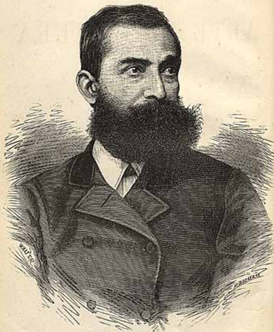
João de Deus