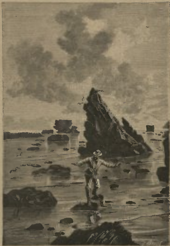
SPECIMEN DAS GRAVERAS (Veja-se igualmente a pagina seguinte)

Obra premiada pela Academia das Sciencias de Franca