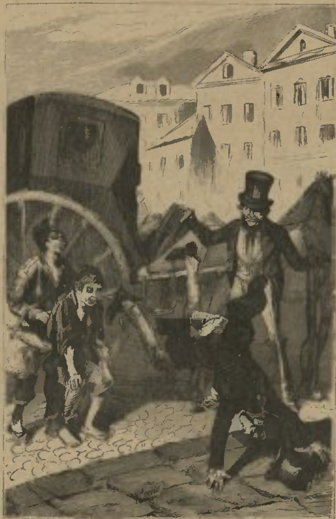
SPELHEN DAS GRAVURAS (Veja-se igualmente a pagina seguinte)