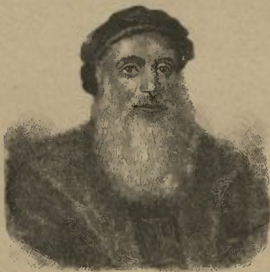
SPECIMEN DAS GRAVURAS

Esta publicação foi destinada a contribuir para o pagamento da dívida de gratidão da patria reconhecida, commemorando nos seus volumes os epicos feitos, os altos enghenos ou as sublimes realizações dos grandes lumens de Portugal que, no passado, deram ao nosso paiz um renome e uma gloria que já nem a acção do tempo, nem as catastrophes da sorte, nem as invejas alleias, podem escurecer ou destruir.