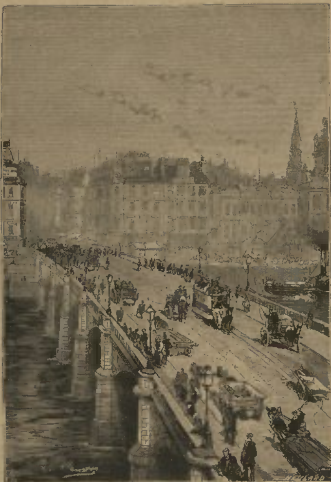
SPECIMEN DAS GRAVURAS (Veja-se igualmente a pagina seguinte)

Obra coroada pela Academia das Sciencias de França