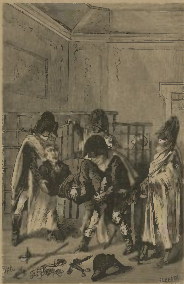
SPECIMEN DAS GRAVURAS (Veja-se igualmente a pagina seguinte)