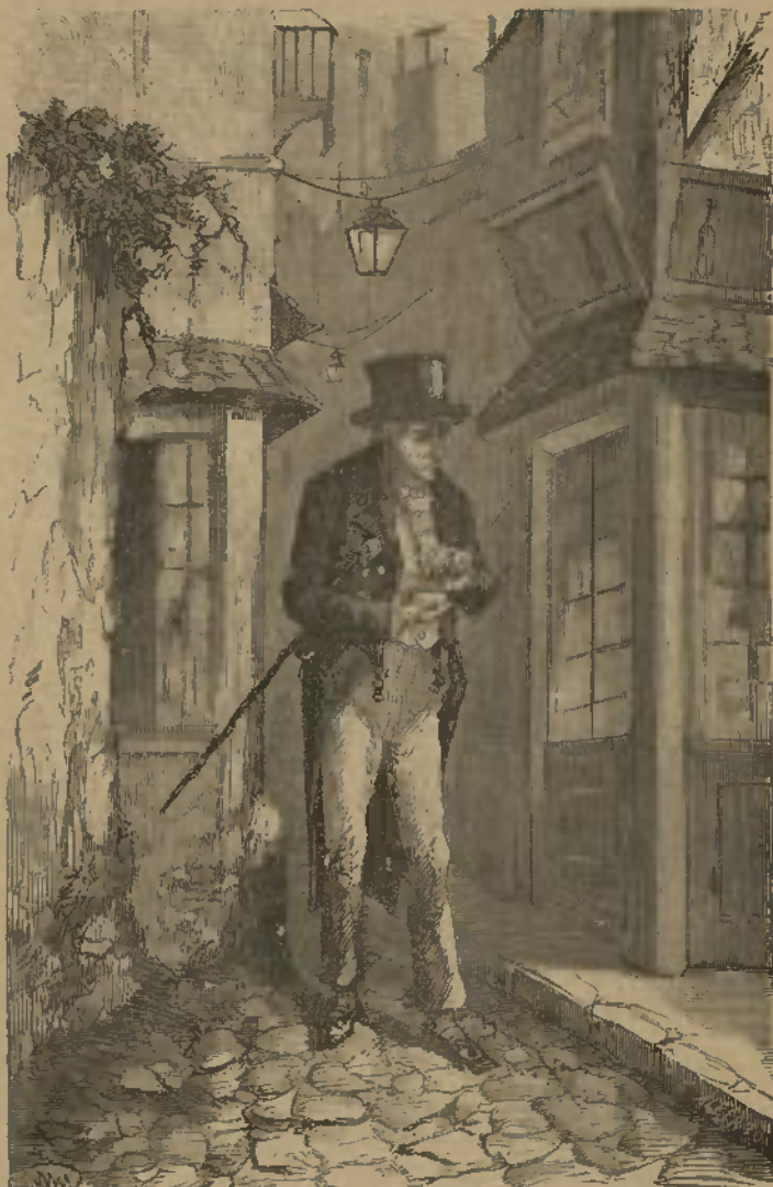
SPECIMEN DAS GRAVURAS (Veja-se igualmente a pagina seguinte)