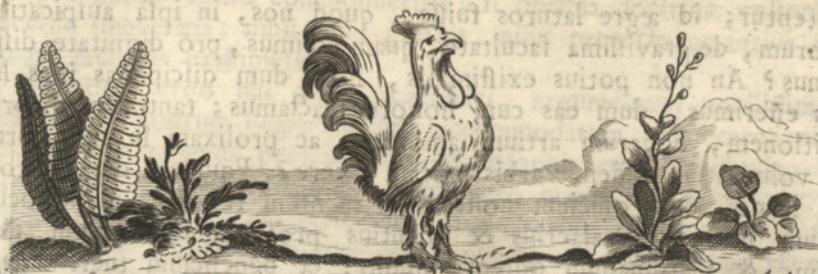
Dom. Miserotti scul.