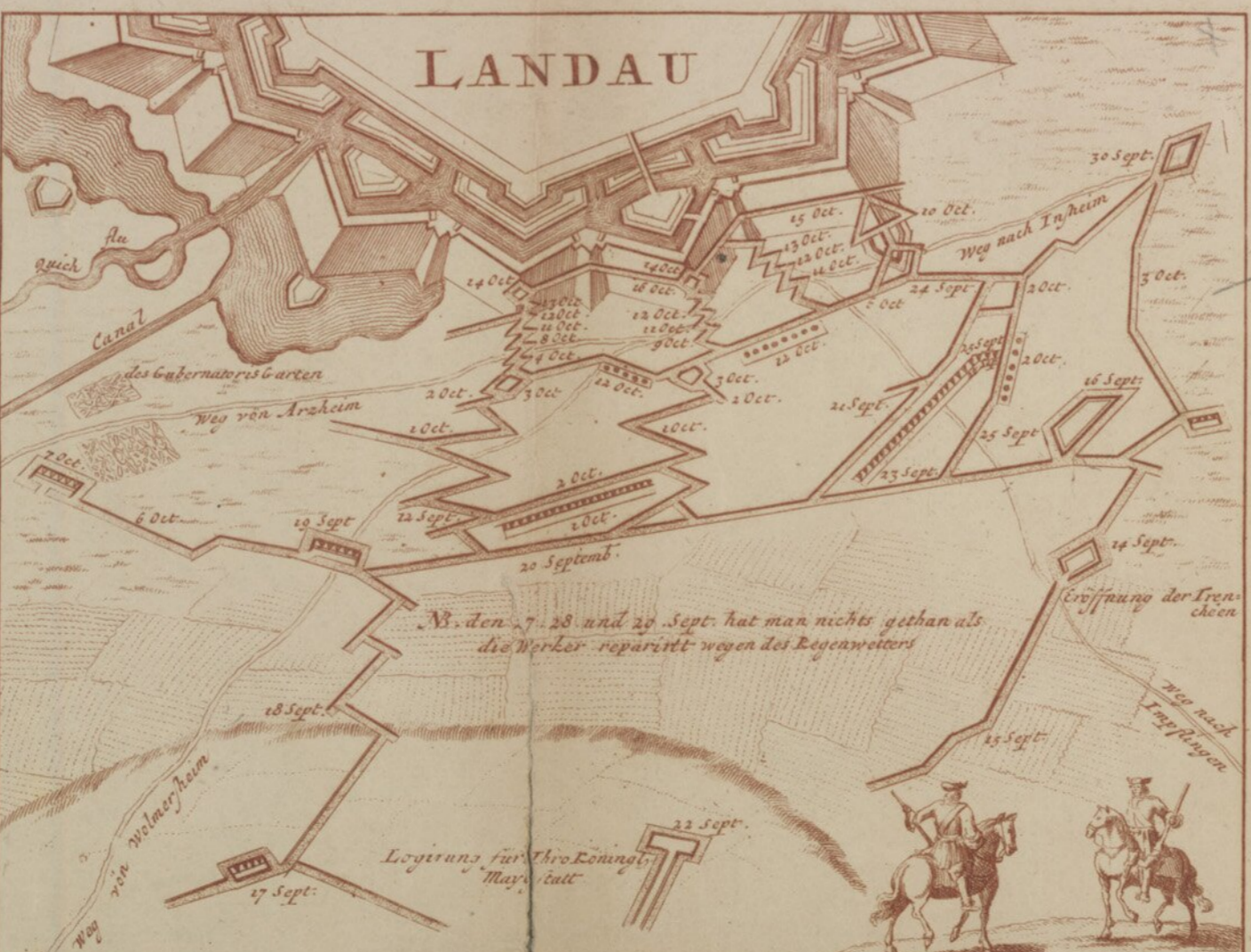
Belagering der Stadt Landau, met eenen Inge, hoe verro- overd' is, ende bekeft des Roeysschen Konings en P. I. van Baden. Overgegeven d' 28 Nov. 1704. Per Schoon exc. Amst. C.P.

Victoria Anglorum et Batarorum Ducibus Roedia et Callenbergis adversus Gallos Duce Tolubano ad Mallagam portu. 24 Aug. 1704.