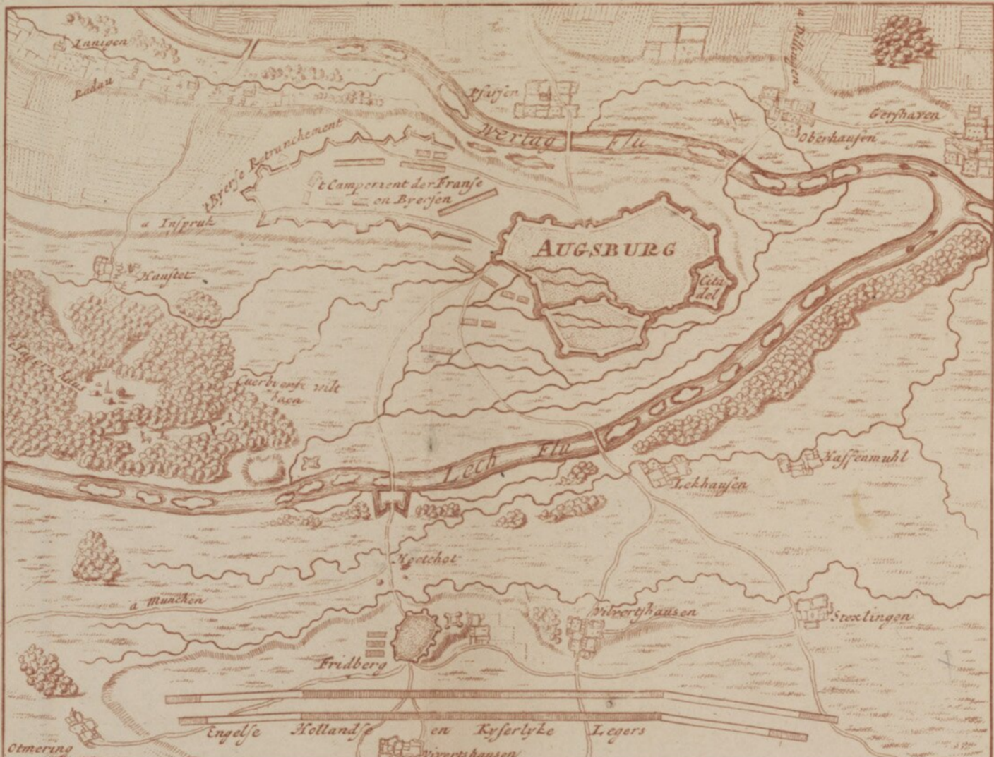
Legers der Byren, Franzen, en Coalliciezen by Augsburg, soo Exercitus Gallorum Bavarorum, et Federatarum ad Augur- tam Vendelicorum, quomodo erant positi 15 et 23 Julii 1704.

Planum oppidi Kestadii, cum ibi feliciter pugnaretur auspicijs Ducis Marlburgii et P. Eugeni, adversus Gallos et Bavaros. 1704.