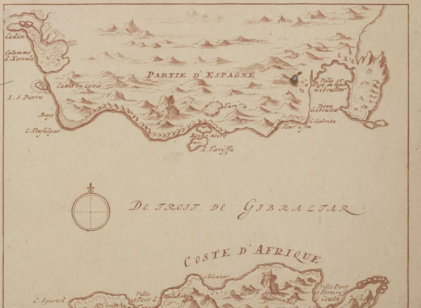
GIBRALTAR de orde Marquis d' Villa Parais belogert d' 12 Nov. 1704 en door 't vol. Almiraal Roede met 30 Eng. en Holl. schepen met drie mitte veroverd' den 28 Nov. 1704. Per Schoon exc. Amst. C.P.

Ob idis arces Landavi, de cetero hac tabella quantum infra pro- fecerit federata, auspicijs Romanorum Regis, et Principis Badavi.