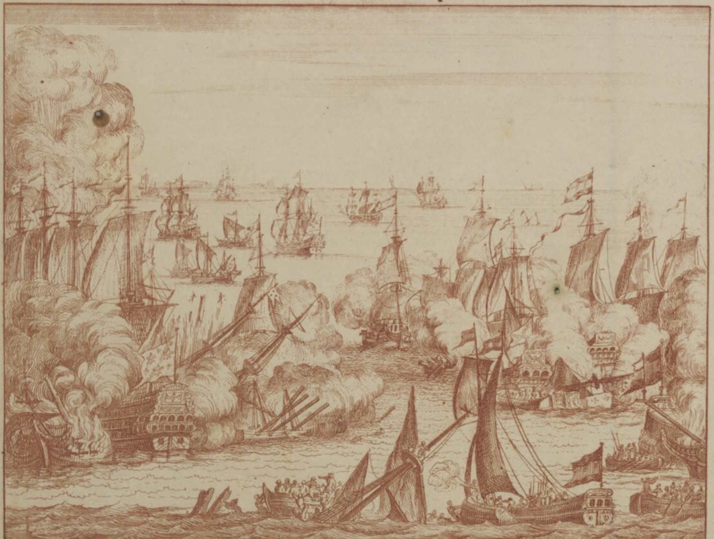
Verwining der Eng. en Holl. onder bevel van de Admiralen Roede en Callenberg, behaelt op de Franzen by Mallaga en onder den G. van Tolub. den 24 Aug. 1704. Per Schoon exc. Amst. C.P.

CALPE Capta a Principe Jussae Darmstadie Anglis et Batavis militibus e navibus coracis yuljis, Ducibus Roedia et Callenbergis. 4 Aug 1704.