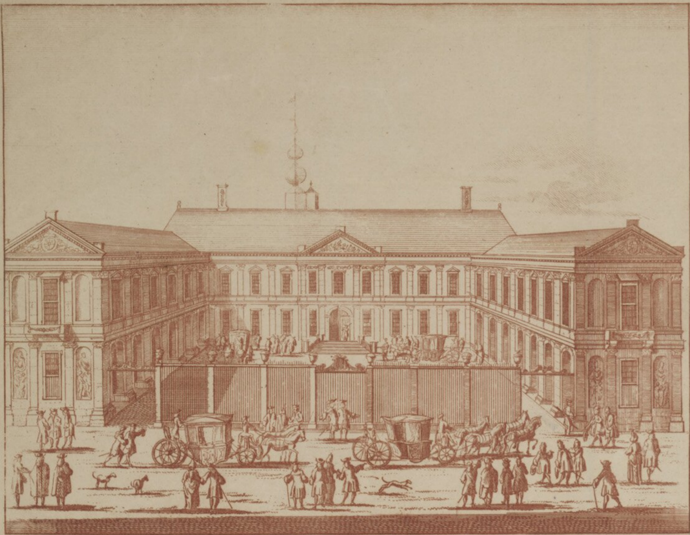
De Oude Hof in 's Gravenhage naar F. CAREL III. 2da verbyf' is ge- weft. Synalecht met de Geconbinde vloet of de Adm. Roede vor- triche den 3 January 1704. Per Schoon exc. Amst. C.P.

Vetus Aula Magna Comitis, in qua commemoratus est CAROLUS III. Hispaniarum Rex, prius quam in Portugalliam transiret cum classe federata.