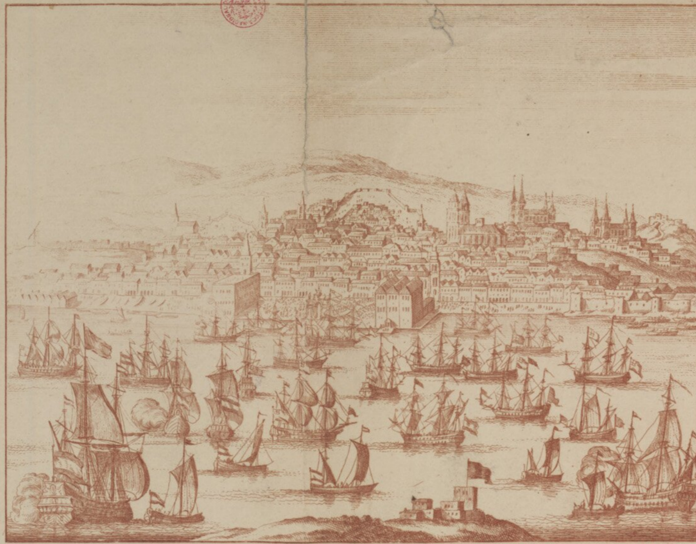
Landing van zyn. W. CAREL de III. Koning van Spanje tot Lissabon in Portugael den 7 Maert 1704.

Vetus Aula Magna Comitis, in qua commemoratus est CAROLUS III. Hispaniarum Rex, prius quam in Portugalliam transiret cum classe federata.