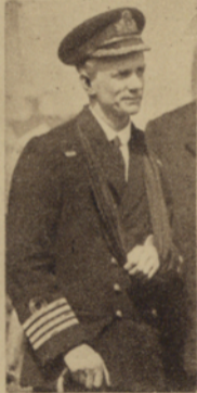
O Capitão Carpenter que commandava o "Vindictive" no "raid" sobre Zeebrugge

O navio de guerra britânico "Vindictive" como regressou do combate. (Depois disso o "Vindictive" foi mettido a pique para servir de navio bloco á entrada do porto de Ostende.)