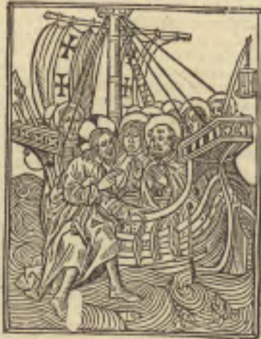
Quien es este / que los vientos y la mar le obedescen?

E n una nauezilla: subiēdo Jesu christo en una nauezilla: figuieron lo sus discipulos/ y leuātose tan grāde tempestad en la mar: que la nauezilla quasi se cobria de ondas. Y el dormia/ y llegarō a el sus discipulos: y despertaronlo diziendo. Señor salua nos q̄ perescemos. Y dixoles el señor. ¿Por que temeys hombres de poca fe? Y entonces leuantose/ y mando a los vientos/ y la mar: y houo luego bonança/ y serenidad: y los hombres de aquella tierra marauillaron se diziendo.